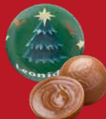
Boule Noël pâte de noisettes lait