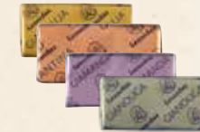
GIA Praliné, praliné aux brisures de feuilletine, praliné aux éclats d'amande, praliné aux brisures de nougat