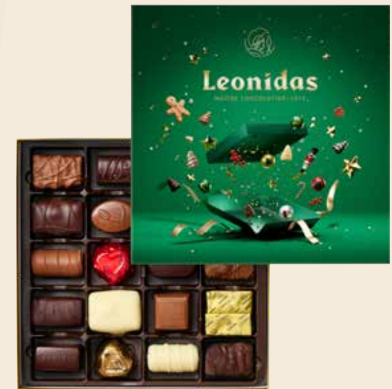
Coffret vert carré

Coffret de chocolats iconiques, comme le célèbre Manon, ainsi que des pralinés et ganaches en chocolat noir, lait ou blanc.