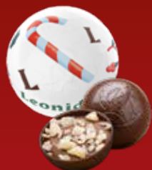
Boule Noël praliné pétillant noir