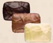
NOISETTE MASQUÉE Praliné avec une noisette entière