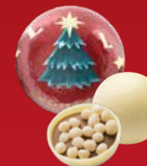
Boule Noël praliné soufflé blanc