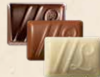
DUETTO Ganache au chocolat noir à la fraise et vinaigre balsamique ou au chocolat au lait, crème de nougat et graines de sésame ou au chocolat noir yuzu et saveur fruit du dragon

Ces chocolats ne représentent qu'une partie de notre offre.