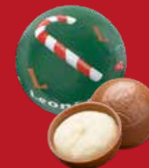
Boule Noël vanille lait