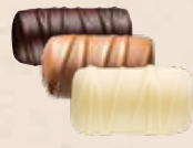
BÛCHE PRALINÉ Praliné tendre