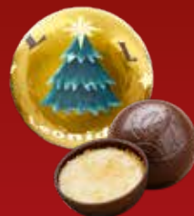
Boule Noël crème brûlée noir