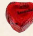
FOREVER ROUGE Chocolat au lait, praliné