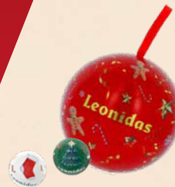
Boule de Noël métal