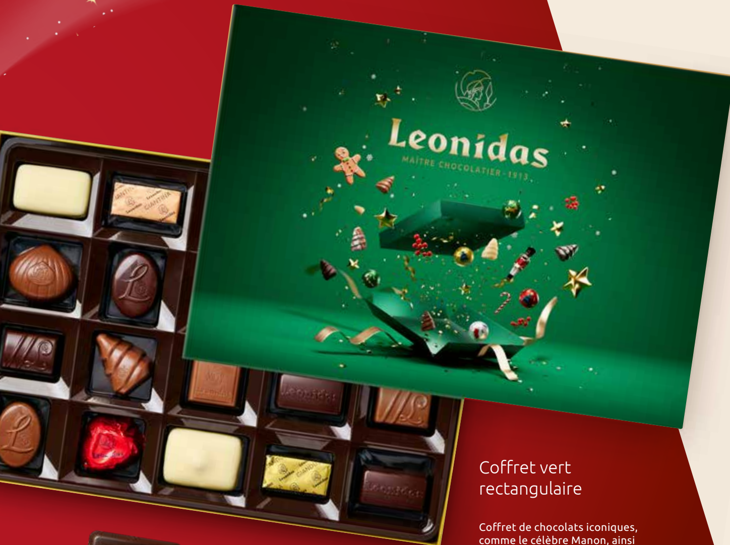
Coffret vert rectangulaire

Coffret de chocolats iconiques, comme le célèbre Manon, ainsi que des pralinés et ganaches en chocolat noir, lait ou blanc.