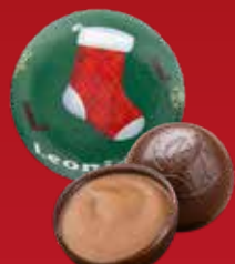
Boule Noël praliné noir