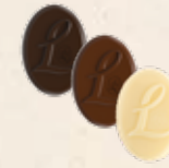
LOUISE Praliné saveur caramel, Praliné saveur caramel aux noisettes caramélisées