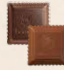
CARRÉ CROQUANT Praliné au riz soufflé