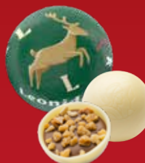
Boule Noël praliné noisettes blanc