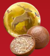
Boule Noël praliné biscuit lait