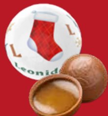
Boule Noël caramel salé lait