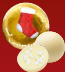
Boule Noël citron meringue blanc