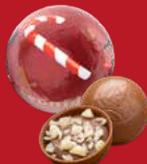
Boule Noël praliné pétillant lait