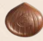
MARRON CAFÉ LAIT Praliné saveur café