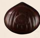
MARRON NOISETTE NOIR Praliné saveur café aux noisettes caramélisées