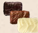
CASALEO Praliné au riz soufflé