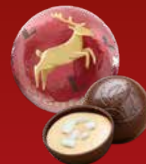
Boule Noël Mont-Blanc Marron noir